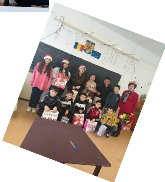
CONCEPTUL DE FOMO („FEAR OF MISSING OUT”) CLASA AVII-A