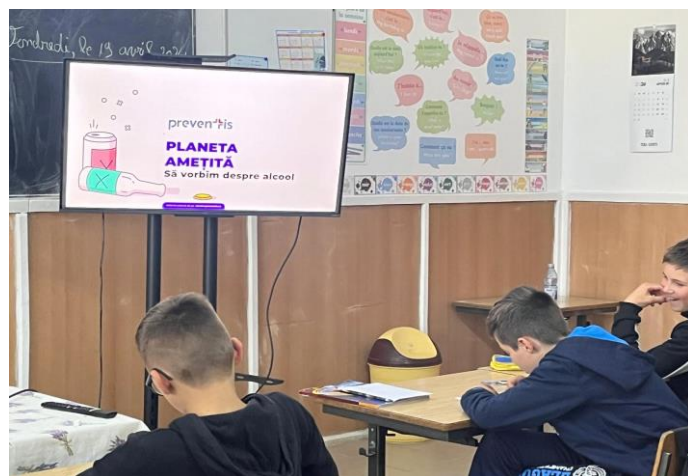
CLASA A VI-A